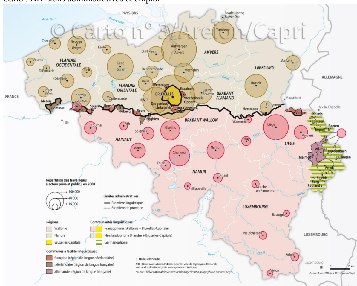
Carte : Divisions administratives et emploi